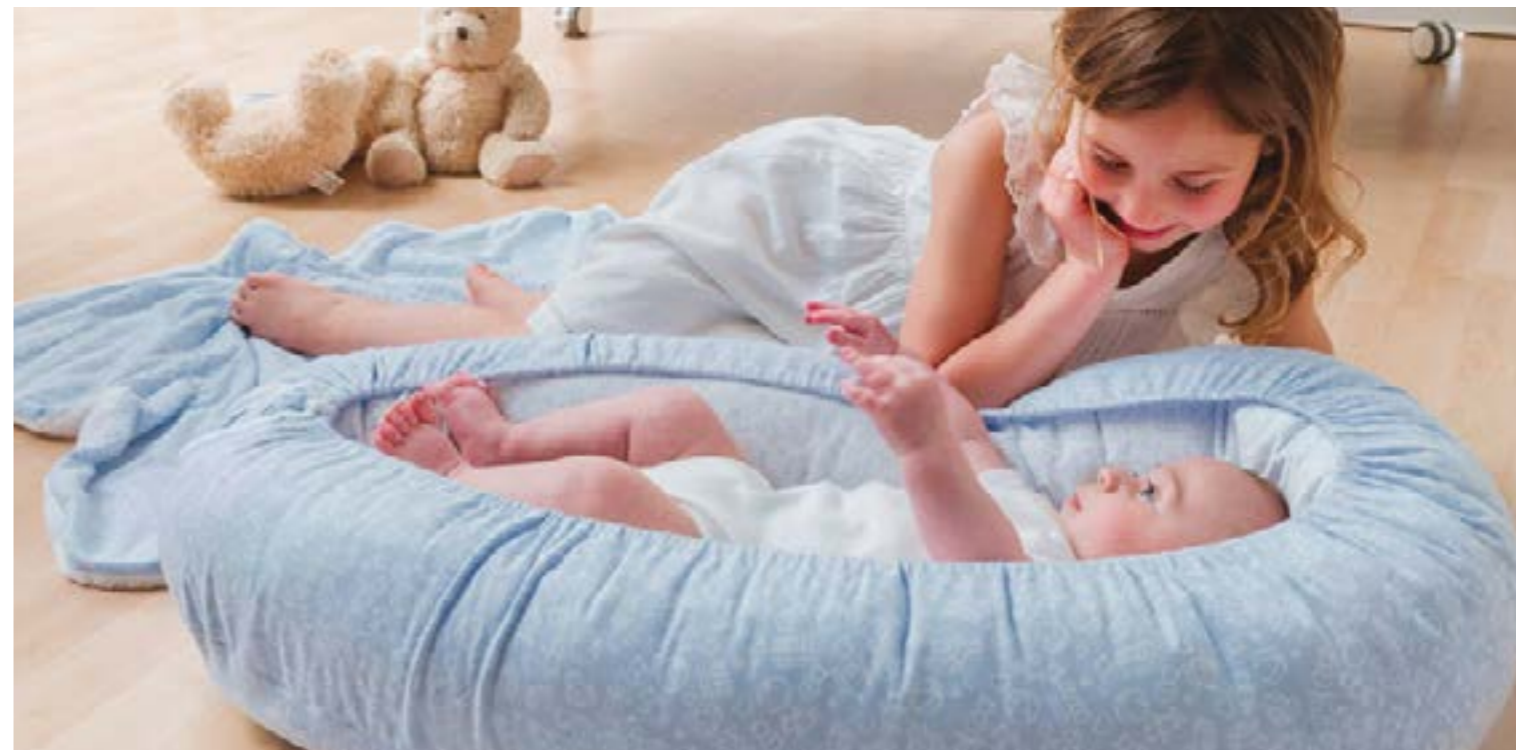
4 Family Time coccole in famiglia