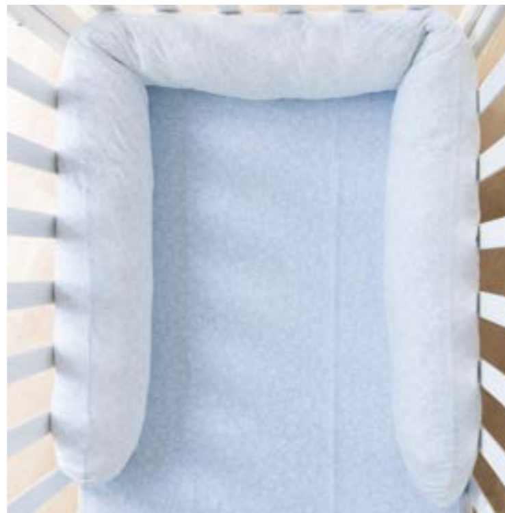
2 Salvabimbo incluso