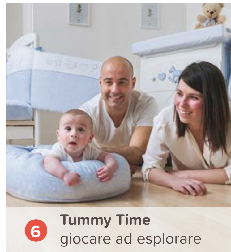
6 Tummy Time giocare ad esplorare