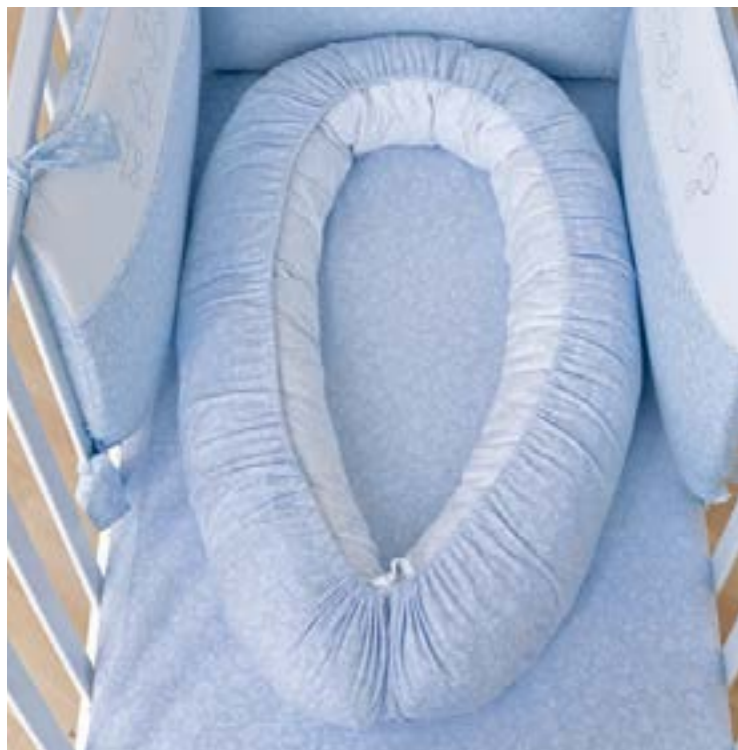
1 Riduttore culla-lettino