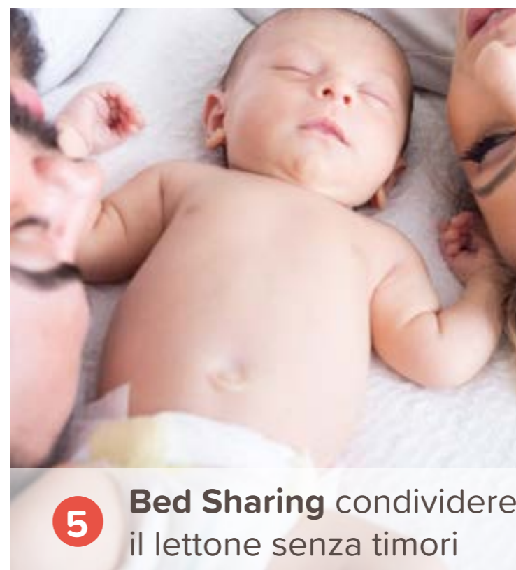
5 Bed Sharing condividere il lettone senza timori