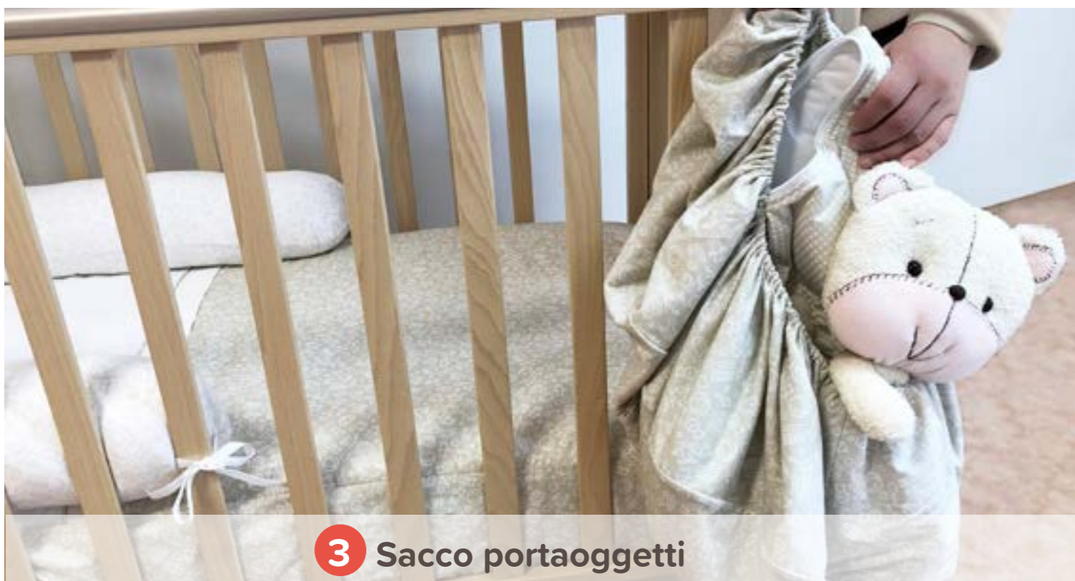
3 Sacco portaoggetti